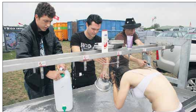
One for all Washing hair or dishes or just drinking. This sink here at the "bathroom" helps you with the lot.

both aged 20, from Sankt Gallen/Switzerland. They came here to brush their teeth, while next to them people wash their hair or their dishes or fill canisters with drinking water. What has started as a simple bathroom has evolved quickly to another important social meeting point. If you'd like to get to know new people or catch something of the real spirit of Wacken, this is definitely the place to be! til Translation: Th. Heintzsch