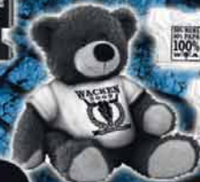
BEAR - ANNIVERSARY