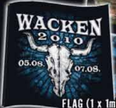
FLAG (1 x 1m) LOGO 2010