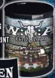
COFFEE MUG AIRPIC ALLOVER PRINT