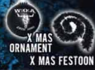
X MAS ORNAMENT X MAS FESTOON