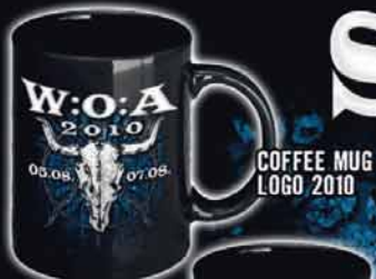
COFFEE MUG LOGO 2010