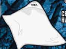
CELL PHONE HANGER