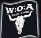
FLAG (1 x 1m) ESTD. 1990