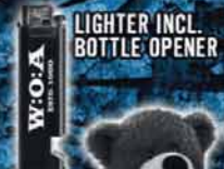
LIGHTER INCL. BOTTLE OPENER