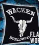
FLAG (1 x 1m) WORLDWIDE