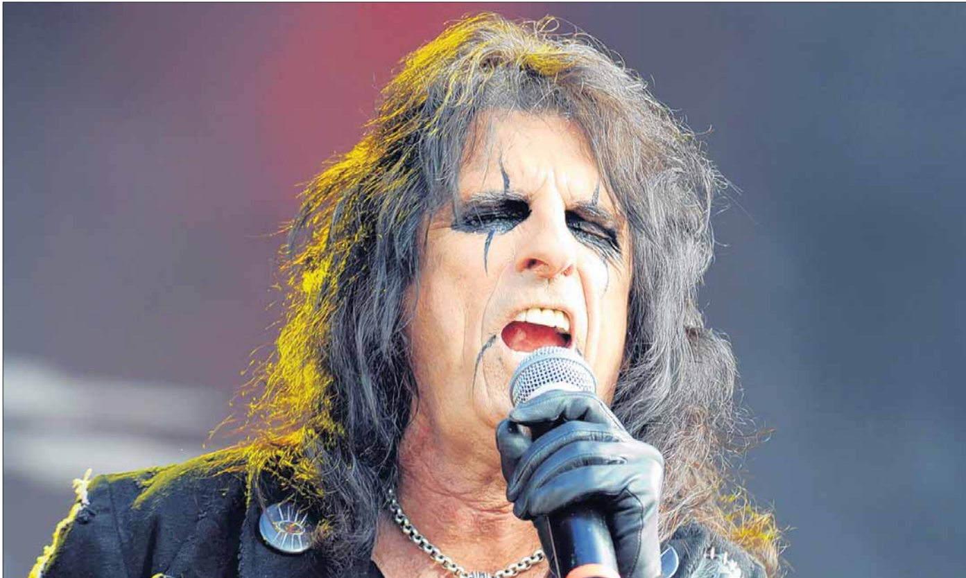
Rock statt Rente: Alt-Rocker Alice Cooper gestern Abend auf der W:O:A-Bühne vor tausenden Fans.