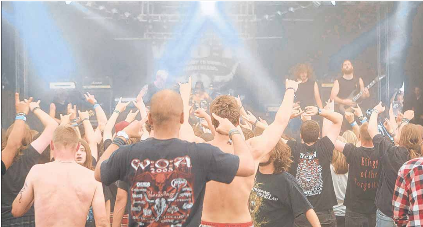
Letting yourself go: W:O:A makes it easier even for shy people.