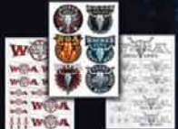
STICKERSET DIV STICKERSET BLACK STICKERSET ESTD. 1990