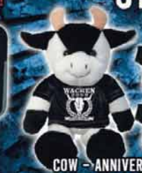
COW - ANNIVERSARY