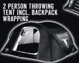
2 PERSON THROWING TENT INCL. BACKPACK WRAPPING