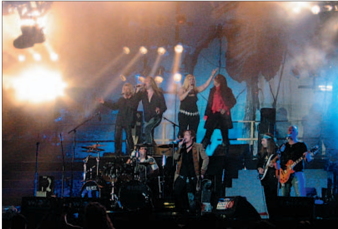
The German solo project „Avantasia“ was one of the highlights of the festival.

The solo project by the German power-metal singer Tobias Sammet (also frontman for the