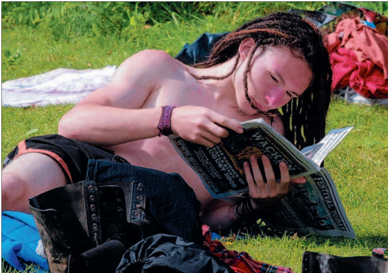
Metal is life ...