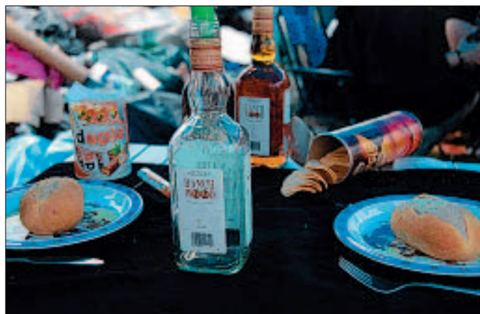
Das Liebesmenü zwischen Wohnwagen und Müllberg.