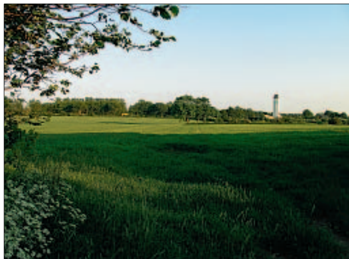
The day before ...