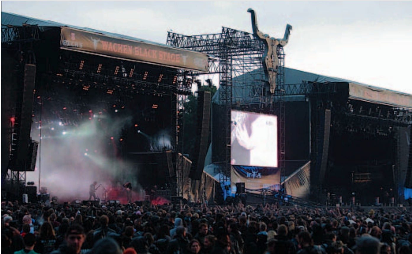
Metal is black ...